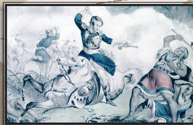
8) Mort de Tecumseh