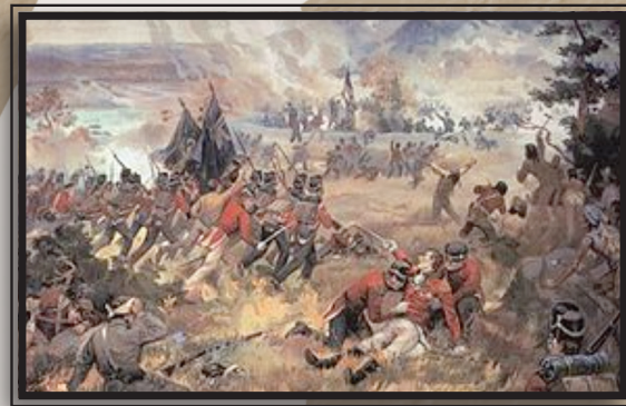
5) Bataille de Queenston Heights