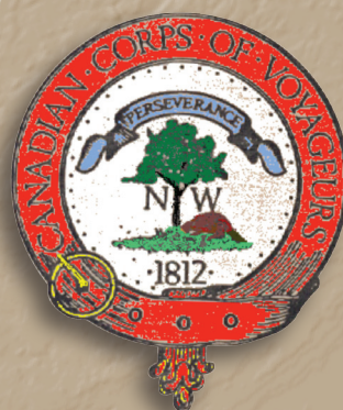
6) Corps des Voyageurs