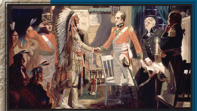
9) Brock rencontre Tecumseh