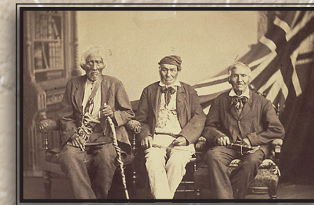
1) Vétérans des Six Nations